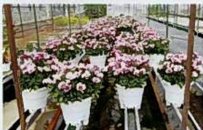
トルコギキョウ鉢物用品種の選抜