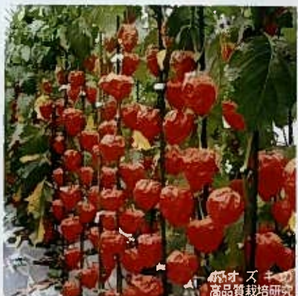
ホオズキの高品質栽培研究