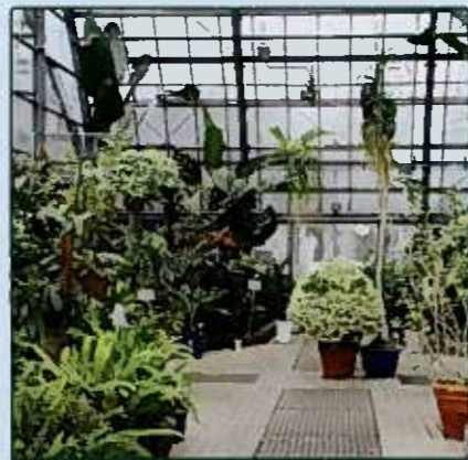
展示温室(内観) Greenhouse for Exhibition