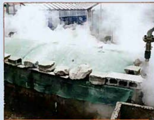
土壌消毒槽 Tank for Soil Disinfection by Hot spring