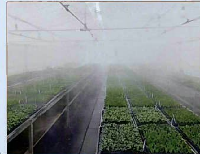
ミスト温室 Greenhouses for Mist Propagation