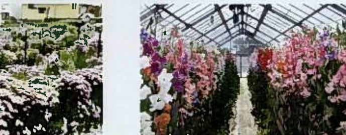
スイートビーの交配育種圃場