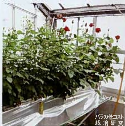
バラの低コスト栽培研究