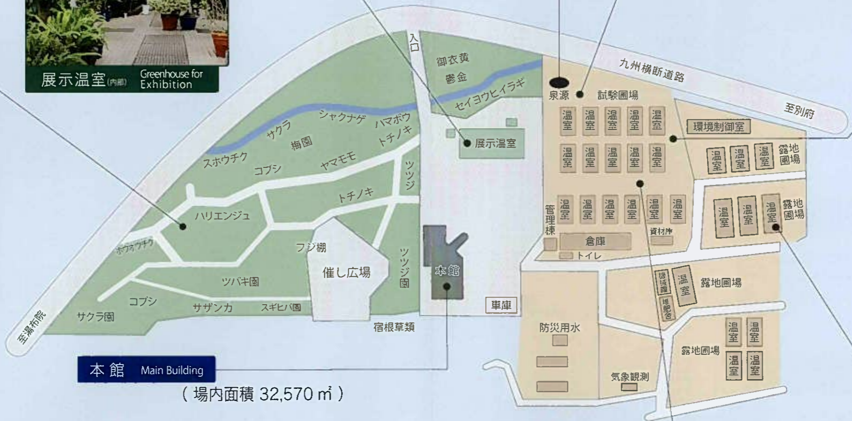
本館 Main Building (場内面積 32,570 m 2 )