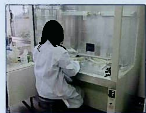
病害虫室 Diseases and Insect Pests Research Room