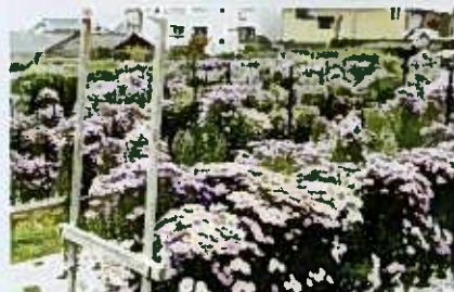
ヤマジノギクの交配育種圃場