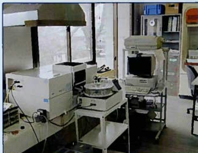
土壌実験室 Soil and Fertilizer Experimental Room