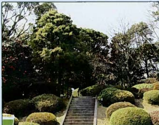
植物園 Botanical Garden