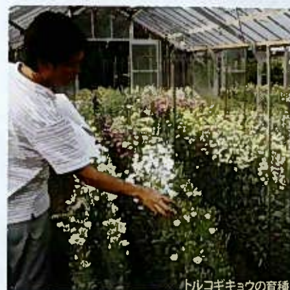
トルコギキョウの育種