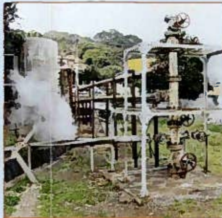
泉源 Hot spring Source