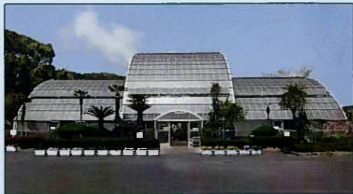
展示温室 Greenhouse for Exhibition