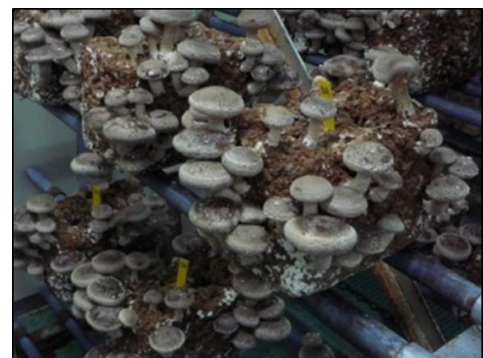
図3 高温区の発生状況

10点: A2L、8点: AM・BL・BM、6点: B2L、4点: AS・CM、 2点: BS・C2L・CL・CS、0点: A2S・B2S・C2S