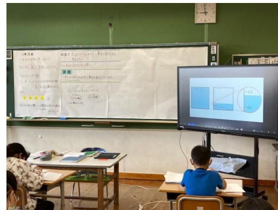
4年 算数科 ⇒ 教材拡大投影