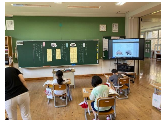
1年 国語科 ⇒ 板書と教材の連動