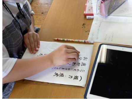
5年 国語科 ⇒ 1人1台端末の活用