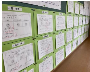
「あいさつレベル」の振り返り