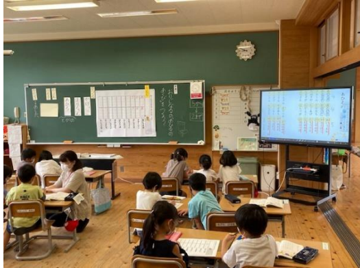
1年 国語科 ⇒ 教材拡大投影