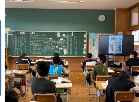
6年 道徳 ⇒ 板書と教材の連動