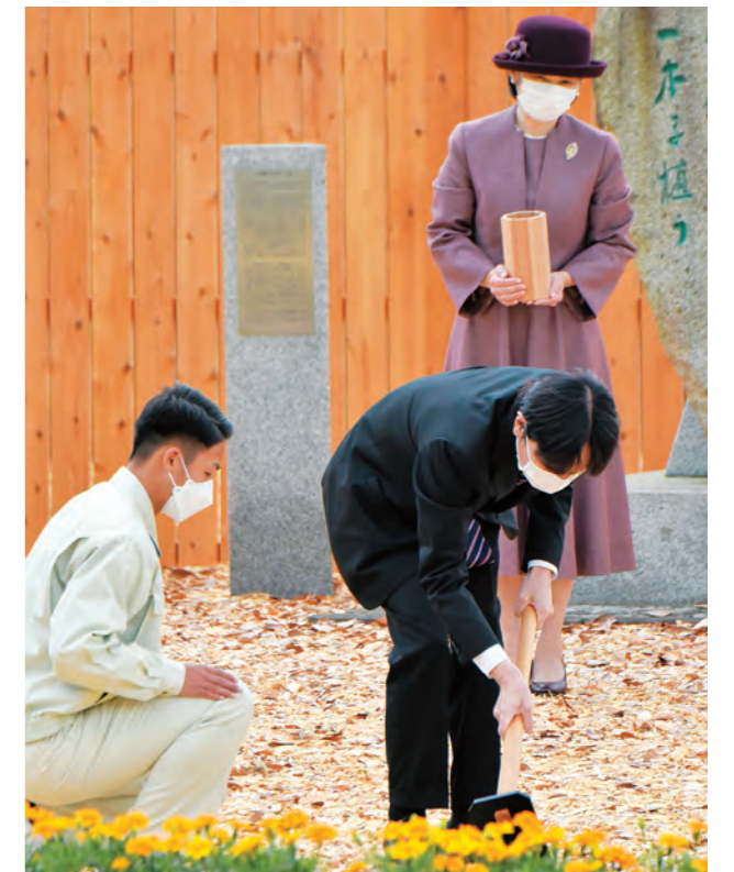
埋戻しをされる皇嗣殿下