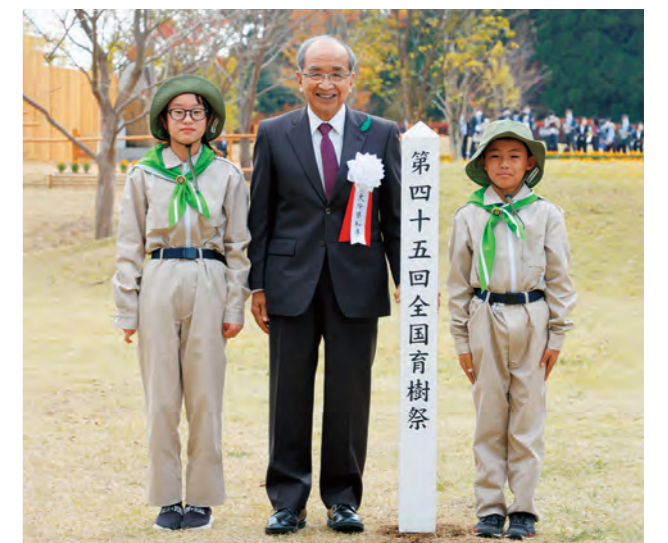
大分県知事 広瀬 勝貞