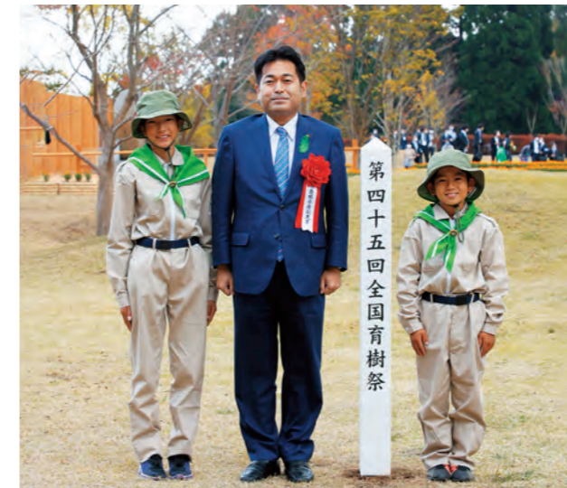
農林水産副大臣 野中 厚