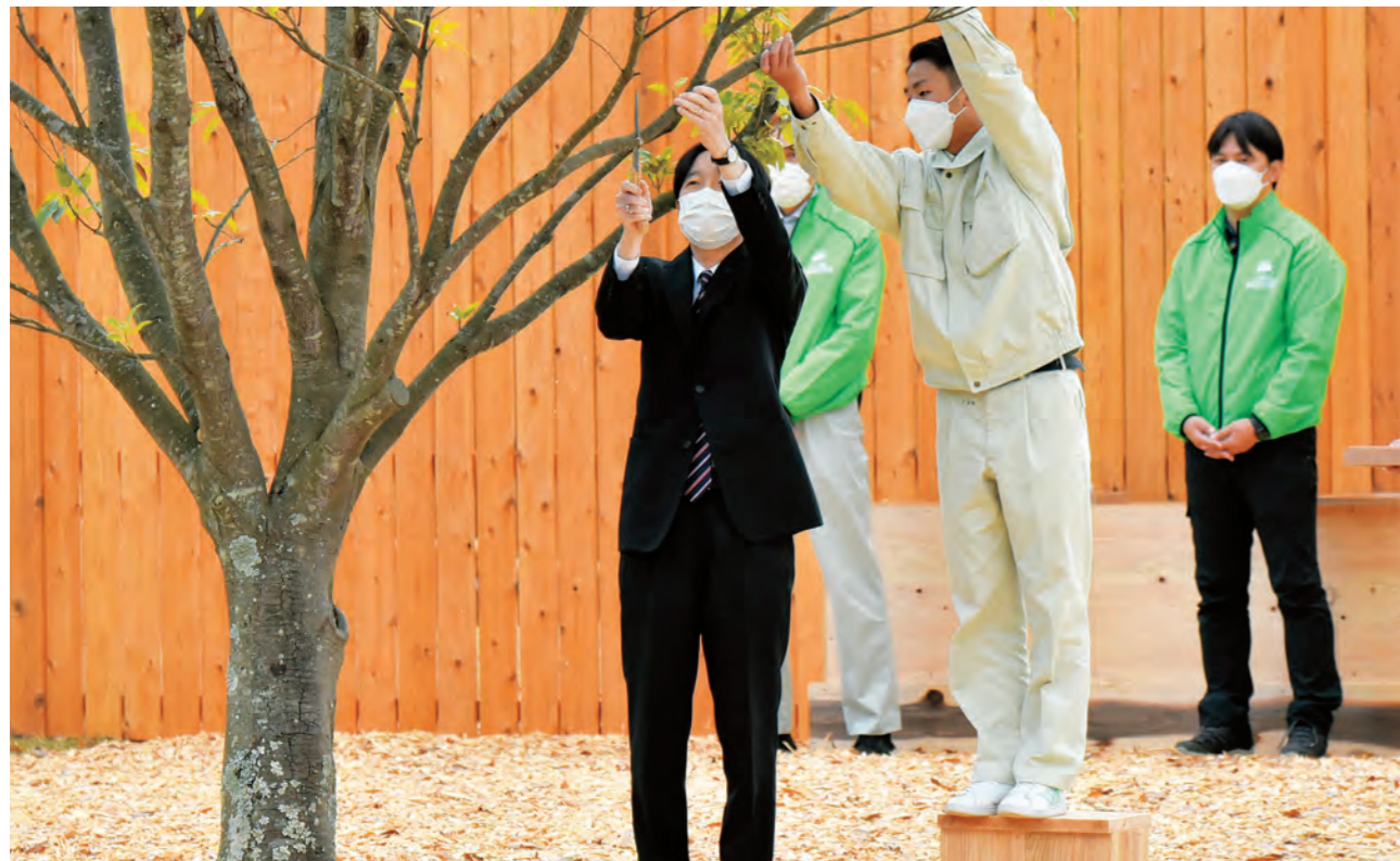
アカガシの枝打ちをされる皇嗣殿下