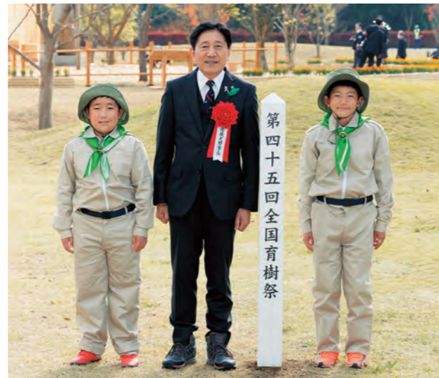
豊後大野市長 川野 文敏