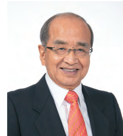
第45回全国育樹祭大分県実行委員会会長