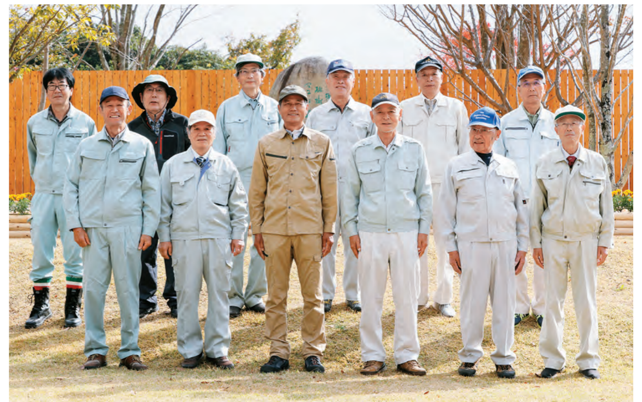
大分県庁退職林業技術者連絡協議会