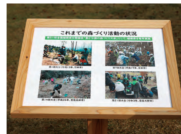
「これまでの森づくり活動の状況」

平成12年の第51回全国植樹祭では、アカガシやカツラを含めた33種類、約13,000本が植樹されました。第51回全国植樹祭を開催後、豊かな国の森づくり大会として、県植樹祭を毎年実施してきました。