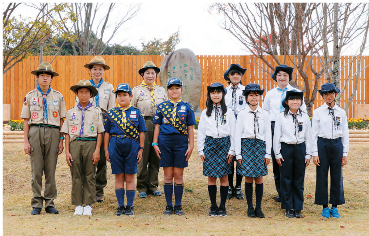
公益社団法人日本ボーイスカウト大分県連盟