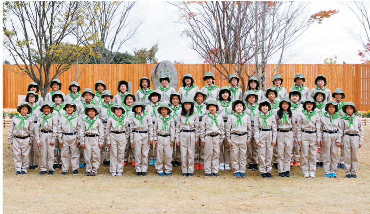
大野小学校みどりの少年団