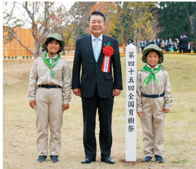
茨城県議会議長 伊沢 勝徳