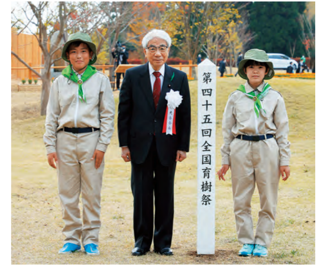
大会会長（参議院議長） 尾辻 秀久

大会会長をはじめとした参加者の皆様が、緑の少年団やボーイスカウト・ガールスカウト等と一緒に記念育樹を行いました。