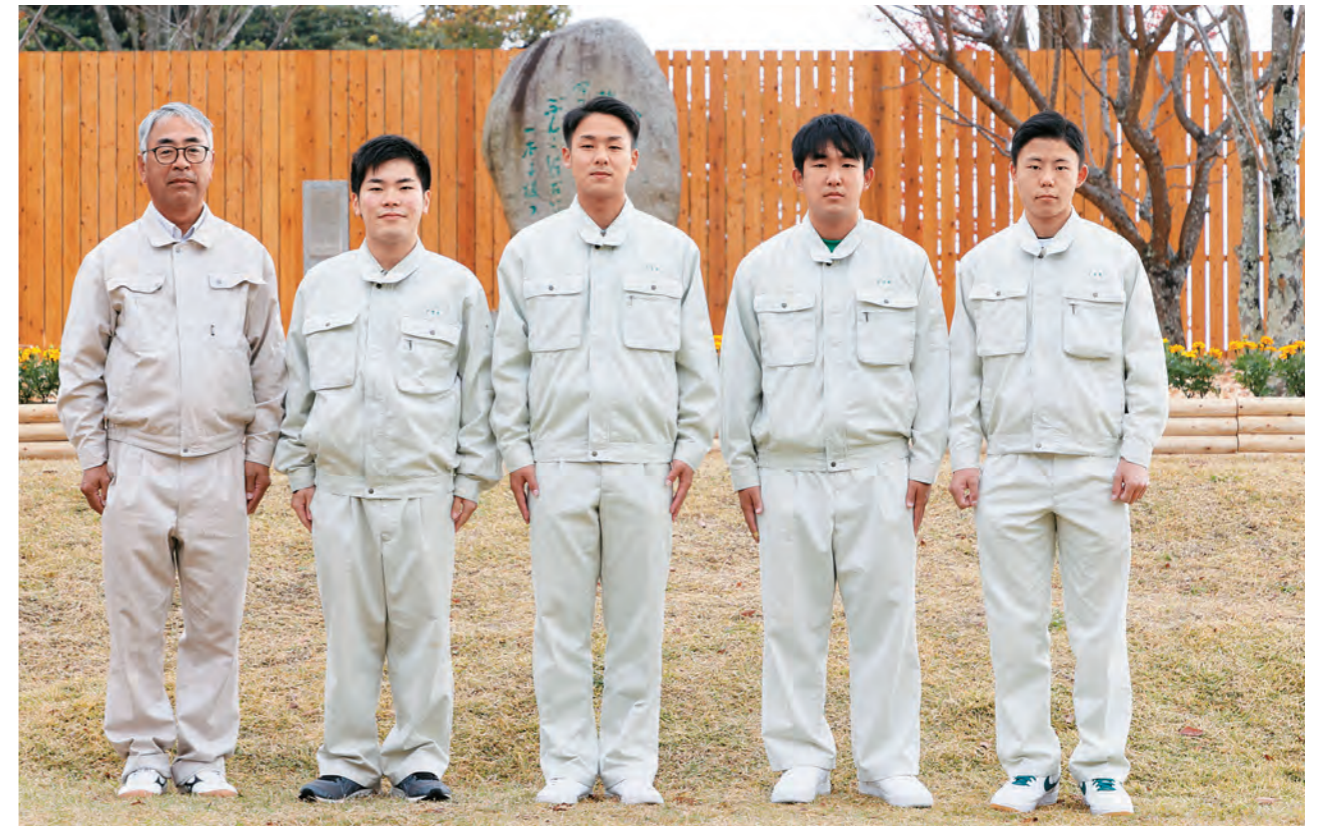
大分県立日田林工高等学校