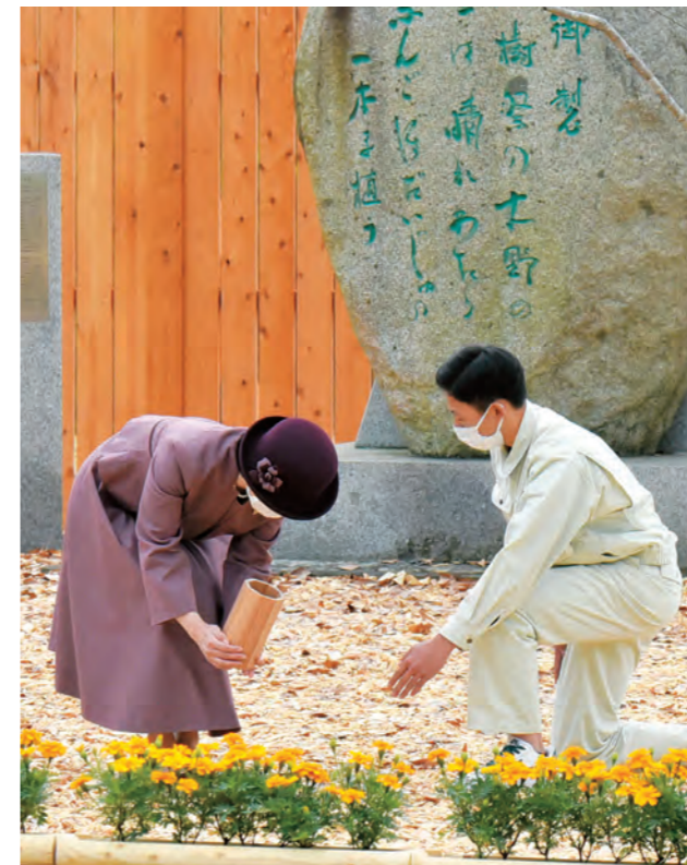
施肥をされる皇嗣妃殿下