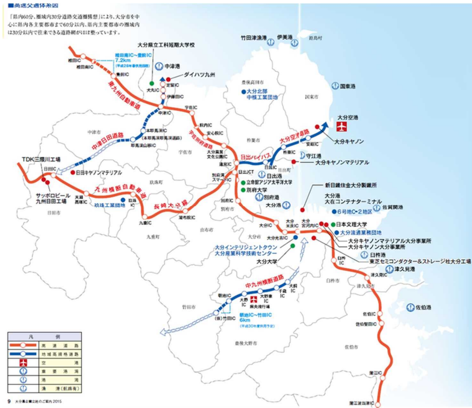
図表7 県内の主要交通インフラ及び支援機関等

さらに中小企業者やスタートアップを支援する、(公財)大分県産業創造機構(所在地:大分市)、大分県よろず支援拠点(所在地:大分市)、おおいたスタートアップセンター(所在地:大分市)、商工会(所在地:中津市、宇佐市安心院町・院内町、豊後高田市真玉町、姫島村、国東市、杵築市、日出町、玖珠町、九重町、由布市庄内町、大分市野津原町、竹田市直入町、豊後大野市、臼杵市野津町、佐伯市弥生町、鶴見)、商工会議所(所在地:大分市、別府市、中津市、日田市、佐伯市、臼杵市、津久見市、竹田市、豊後高田市、宇佐市、竹田市)、大分県商工会連合会(所在地:大分市)、大分県中小企業団体中央会(所在地:大分市)があり、企業の経営相談、研究開発、販路開拓及び人材育成を支援している。