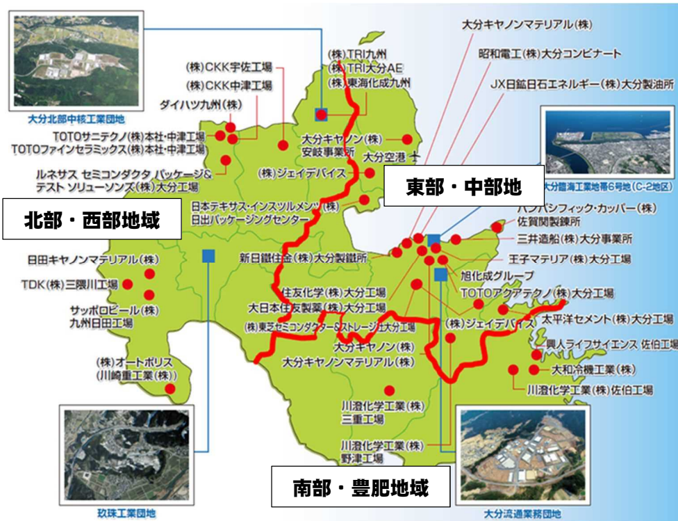
図表 12 主要企業の立地状況、3つの経済圏