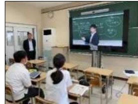
高等学校における遠隔授業