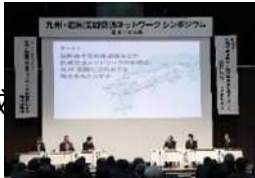
九州・四国 広域交通ネットワーク シンポジウム