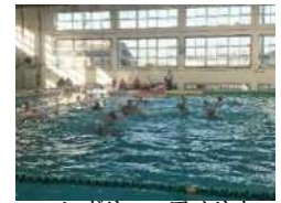
ハンガリー・アメリカ女子水球代表の県内合宿