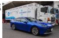
水素ステーションと燃料電池自動車