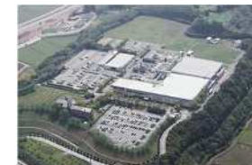
中津市の半導体企業