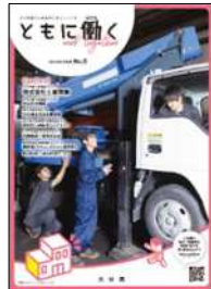
定期情報誌「ともに働く」(発行：大分県)