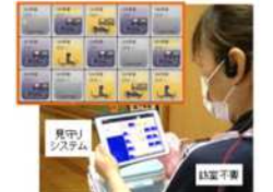
離床センサーと接続した見守りシステム