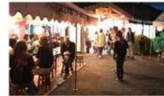
コミュニティビジネス(駅を活用した飲食イベント)