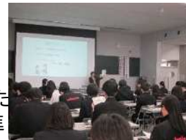
高校生を対象とした消費生活啓発講座