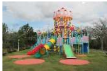
ハーモニーパーク (日出町)