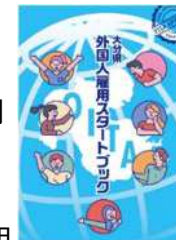
県内企業向け 外国人雇用リーフレット