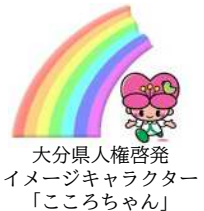
大分県人権啓発イメージキャラクター「こころちゃん」