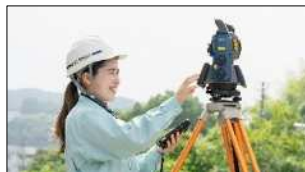
女性のロールモデル紹介(建設産業で活躍する女性)