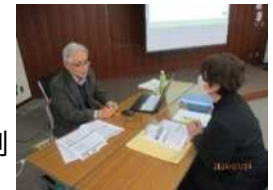
専門家(運営アドバイザー)による支援