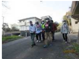
自主防災組織による避難訓練