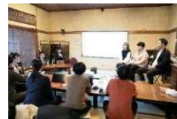
ワーケーション 体験プログラム