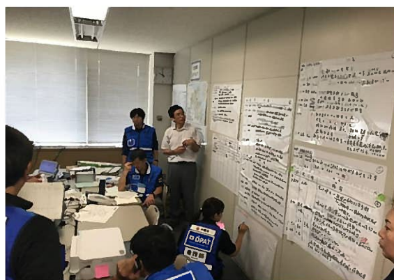
【大分県 DPAT の訓練】