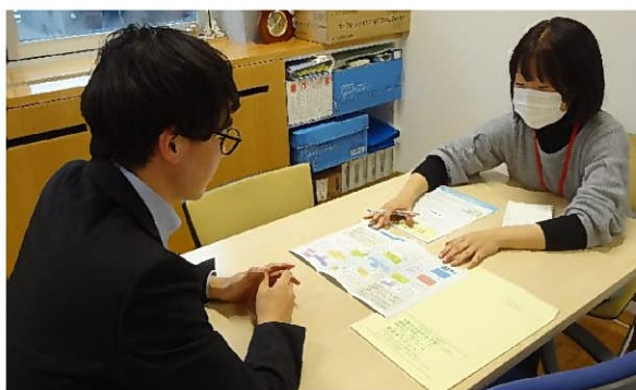
【障害者就業・生活支援センターでの相談支援】