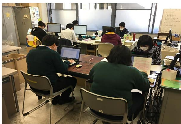
【大分県庁ワークセンター】