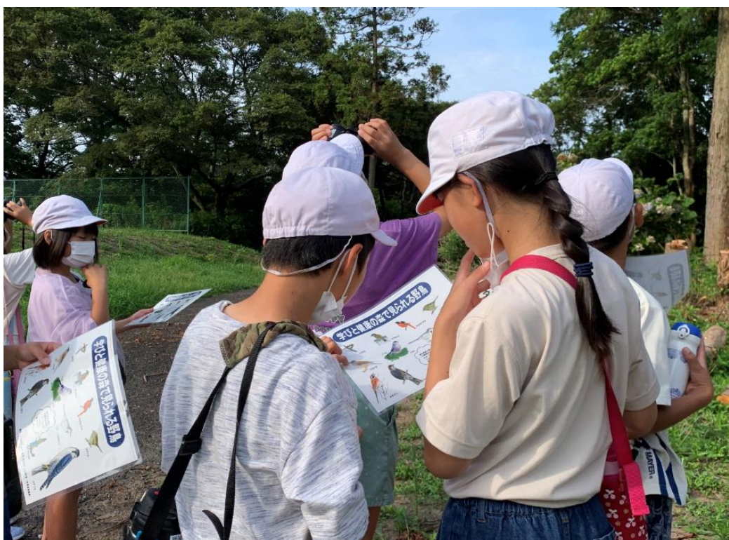
小学校の宿泊研修でのバードウォッチング

(参考：月間社会教育2011-8) 私たちはこのことを肝に銘じ、子どもが確実に成長を遂げる学校の宿泊研修や子どもの野外キャンプの実現に努めてまいります。