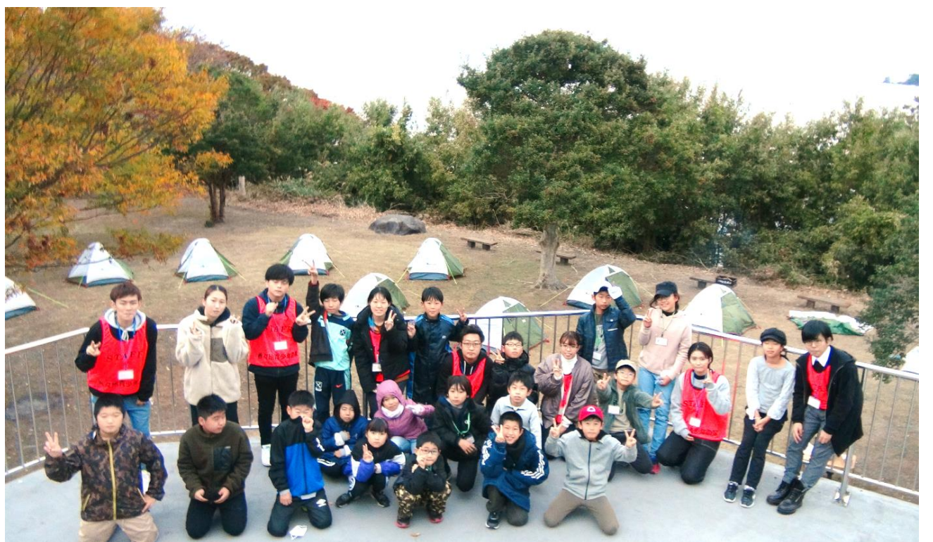
生き活きオータムキャンプでの子どもと大学生