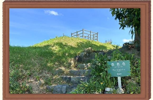
최정화, 〈색색색〉, 2013, 한국.

〈색〉 색의 어머니와 아버지는 자연이다. 어쩔 미뢰도 하늘과 땅은 아름다운 것이지. 그래, 살아있기 때문이다. 색은 자연의 일부에 불과하다. 우리는 살아있습니다. 태양, 달, 별, 바람, 바다, 나무, 풀, 꽃처럼. 우리는 색입니다. 색은 색, 색, 색. 최정화 2013. 9. 17.