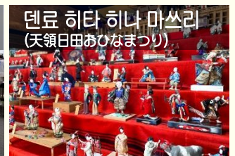
덴료 히타 히나 마쓰리 (天領日田あひなまつり)