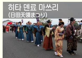
히타 덴료 마쓰리 (日田天領まつり)