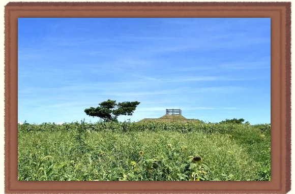
멀리서 보이는 작품의 모습