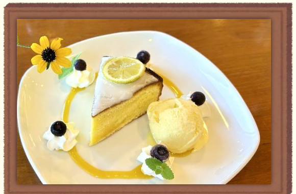
나가사키바나 리조트 캠핑장 입구에 위치한 '카페&레스토랑 하나 키친 fiore'의 레몬 케이크