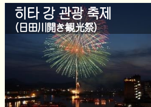
히타 강 관광 축제 (日田川開き観光祭)

5월에 초여름을 알리는 '히타 강 관광 축제', 7월에 약 300년의 역사를 가진 '히타 기온 히키야마 행사', 11월에 에도 시대의 영광을 재현한 '히타 덴료 마쓰리', 2월에는 봄을 알리는 '덴료 히타 히나 마쓰리' 등 4대 축제를 비롯해 연간 수많은 축제가 열리니 여러분의 많은 참여 바랍니다.