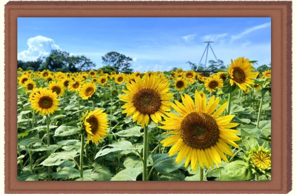
샛노랗게 활짝 핀 해바라기의 모습