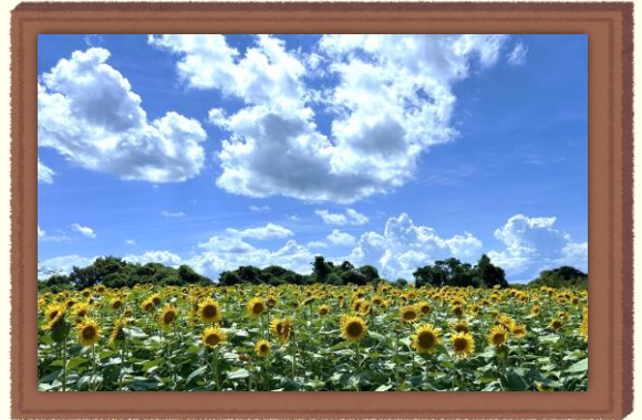
해바라기 꽃밭 일부분의 모습

또한, 곳의 끝에 위치한 캠핑장 입구에는 (기간 한정)푸드 트럭과 카페가 있어 간단하게 끼니를 해결하거나 음료를 마실 수도 있으니 잘 챙겨 먹으면서 안전하고 즐겁게 해바라기와 늦여름을 즐겨 보자.