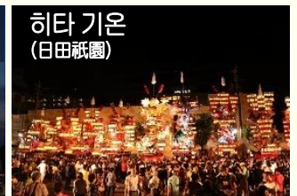
히타 기온 (日田祇園)