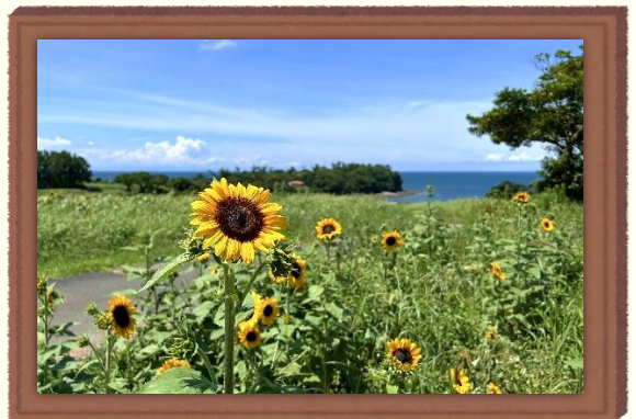
작품 근처에 피어있는 해바라기