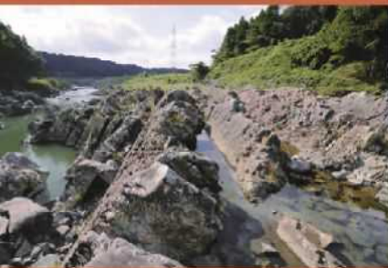
手取蟹戸(てどりがんど) およそ1億年前の地層

豊後大野市の歴史や風土、風景を 楽しむ「菅尾磨崖仏」「江内戸の景」 約5kmのウォーキングイベントです。 初心者の方も一人参加も大歓迎。 専門のガイドさんが観光スポットや 隠れた名所をご案内!豊後大野の 魅力を再発見しませんか!