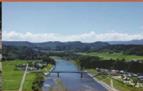
江内戸の景 大野川がもたらした豊かな大地

FAX又は、みえスポーツクラブ(フレッシュランド恵藤建設内)までお申し込みください