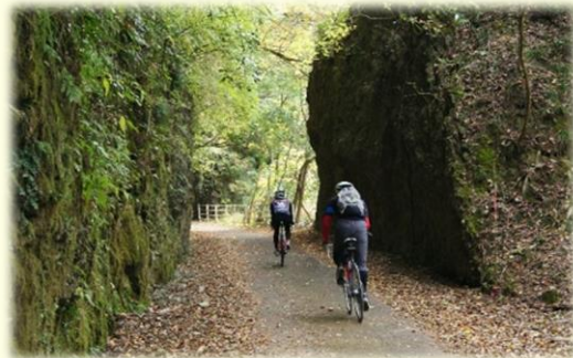
两块大岩石形成的天然通道

枫叶耶马溪自行车道是利用以前的旧铁路改建的，所以坡道比较和缓，是对初学者也很友好的一条自行车道。沿途仍然保留着几处以前的车站设施，游客能在大自然中体验自行车骑行的乐趣。