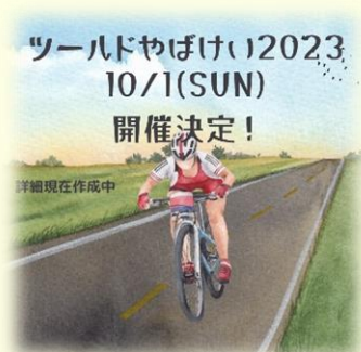
10月1日将举办“环耶马溪一周之旅”