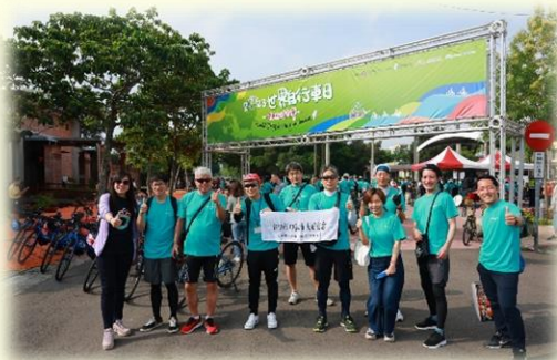
6月参加了台中市的活动