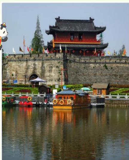
←湖北荆州市荆州古城。 城墙为明清时期重建。

荆州市是一座历史十分悠久的城市，至今仍保留有古代修建的城墙和城楼等重要历史文物。黄石市以前是一座矿产资源丰富的工业城市，现在转型建设成为宜居的园林城市，市中心有一个很大的磁湖，有山有水，居住环境越来越好。