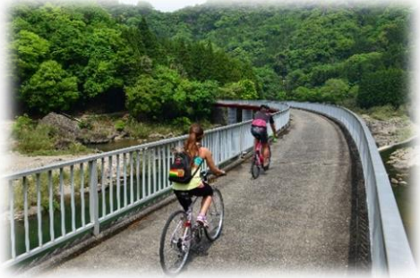
鉄道が通っていた「第二山国川鉄橋」

メイプル耶馬サイクリングロードは、昔の鉄道跡地を利用した自転車道、勾配ゆるやかで初心者にもオススメのサイクリングコースとなっています。今もなお、駅舎が残っている箇所もあり、大自然の中でのサイクリングをお楽しみいただけます。