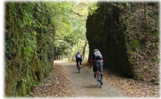
自然の岩の間を通るスポット「切り通し」

メイプル耶馬サイクリングロードは、昔の鉄道跡地を利用した自転車道、勾配ゆるやかで初心者にもオススメのサイクリングコースとなっています。今もなお、駅舎が残っている箇所もあり、大自然の中でのサイクリングをお楽しみいただけます。