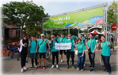
6月に台中市のイベントに参加しました

台湾の台中市とサイクルツーリズムおよび観光友好交流の促進に向けた協定を結んでおり、定期的な交流を行っています。