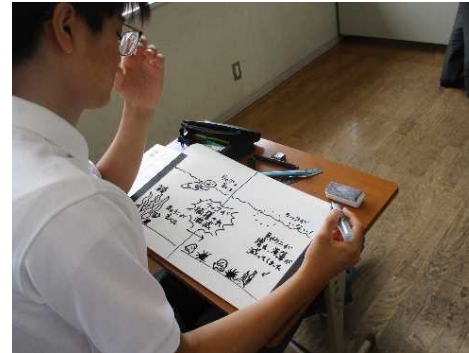
自分の考えをもち、書く