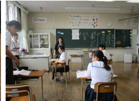
自分の考えを説明する、傾聴する