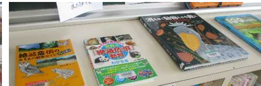
国語科の学習と関連する図書を準備