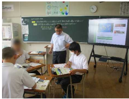
学習形態の工夫 (協働的な学び)