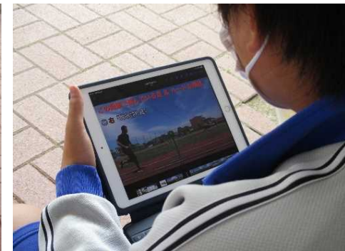
ハードルをリズムカルに跳ぶことに向けて、自分の試技やハードリングのポイントを示した動画を視聴して確認