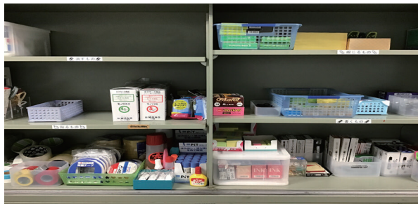
機能別に文房具を配置した棚

また、文房具メーカーの方による「学校における働き方改革」についての校内職員研修を企画・実施して、職場環境を良くしていくことの必要性についての理解を促しました。