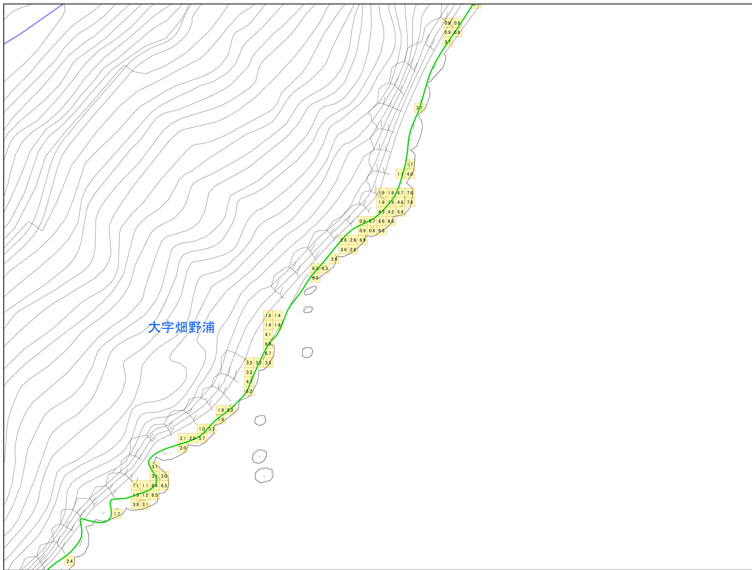
津波災害警戒区域 区域図