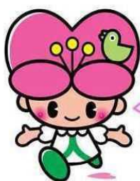
大分県人権啓発イメージキャラクター こころちゃん

こころちゃんの部屋においでよ！ こころちゃんの部屋 で検索 http://www.pref.oita.jp/site/kokoro/