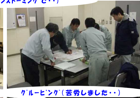
グルーピング(苦勞しました・・・)