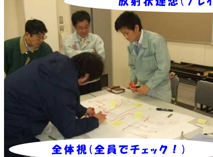
全体視(全員でチェック！)