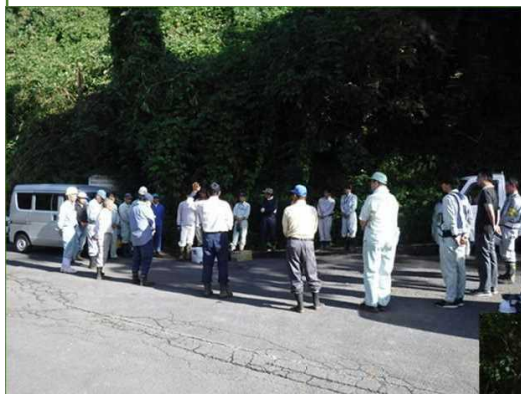
↑参加者打合せの様子