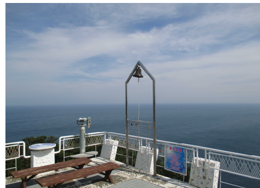
展望台と幸せの鐘