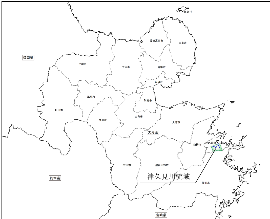
津久見川水系位置図