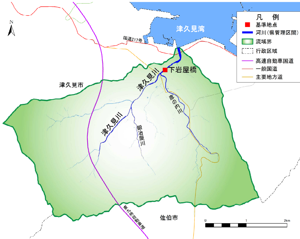
【参考図】津久見川水系平面図