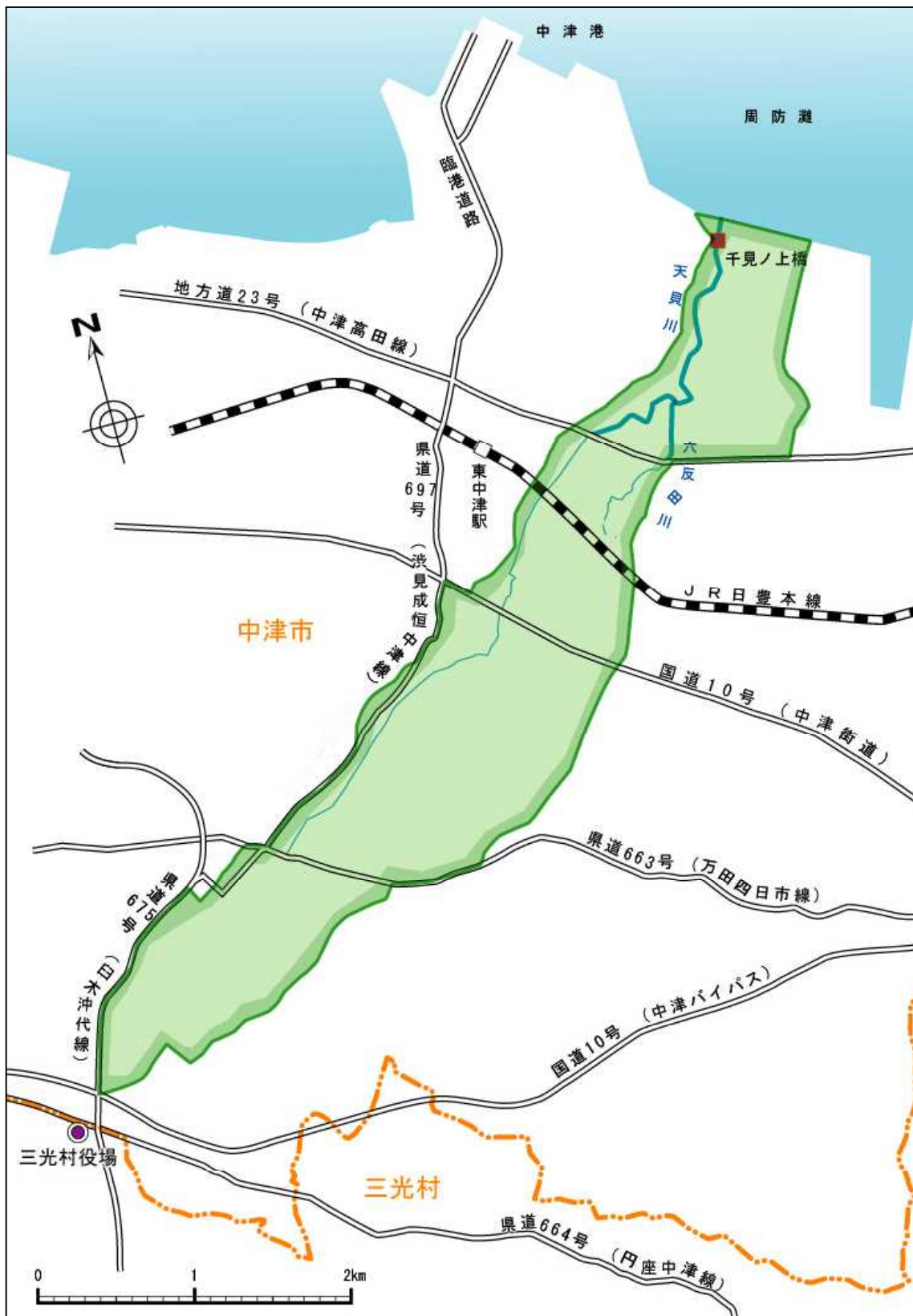
参考 天貝川水系流域図