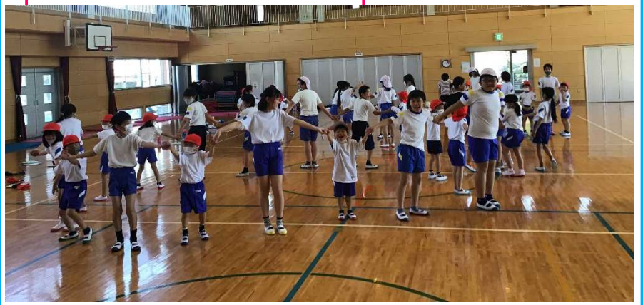
運動好きな児童が増えるような体育授業