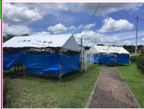
3密回避の更衣室設置 (水泳学習)