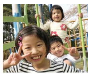
甥っ子や姪っ子との 時間も息抜き

オフの日は目いっぱい好きなことに打ち込む性分。ジムで身体を動かしたり、コロナ禍の前は夫と旅行へ出かけるなど、気分転換は欠かせない。