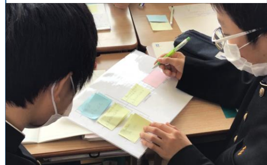
付箋を利用した対話