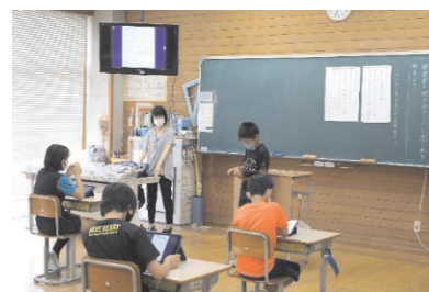
3年 「ホワイト小黒板活用授業」