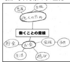
【図1】単元導入時の生徒A

働く理由は、お金をもらうためだと思います。お金がないと、生活していけません。家族を養うのもお金が必要です。あと、学校の先生は生徒のために、病院の医師は患者のために働いているとも言えるので、他人のためでもあると思います。