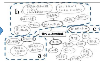
【図2】整理・分析時の生徒A

インタビューやアンケートから、働く理由は「お金のため」「他人のため」「自分のため」「地域のため」の4つであることが分かりました。②一番意外だったのが、「自分のため」という意見です。今度職場体験で行く事業所の方も、「自分の技術をさらに高めたい」と話していました。また、「他人のため」とは学校の先生とかしか考えていっていませんでしたが、ミカン農家の方が「このミカンを食べてくれる人のため」と言っていて、直接会わない人も含まれるんだと思いました。