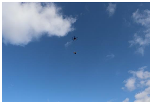
運搬ドローンからの荷下ろし