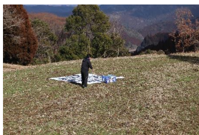
ドローンポートでの受取

配送した救援物資は地元住民が受け取りを行い、衛星電話による通話で安否確認を実施しました。