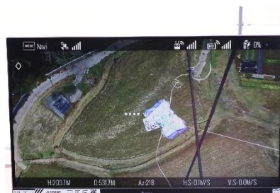
運搬ドローンからの荷下ろし