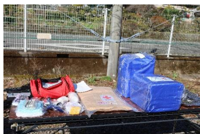
配送した救援物資（計8.5kg）

消防本部からの孤立発生報告に基づき、日田市が住民に電話連絡を行うものの、通話できない状況から、救援物資（衛星電話、毛布・ラジオ等）配送を株式会社ノーベルに要請し、重量物運搬ドローンでの配送（高度30mからの投下）を行いました。