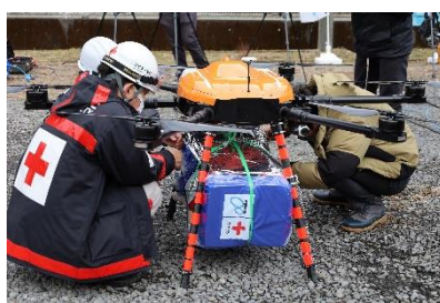
運搬ドローンへの荷物固定