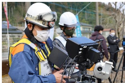
消防本部ドローン隊による操縦