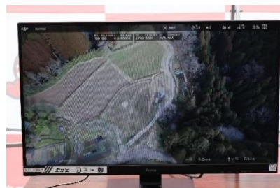
ドローンポートの確認