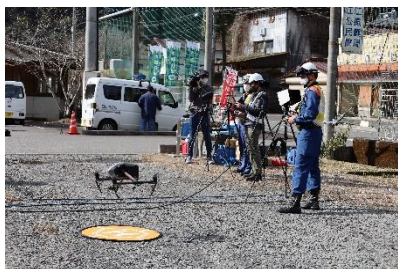
災害調査ドローンの飛行

日田警察署の被害報告に基づき、消防本部のドローン隊が災害調査を実施し、道路寸断先の集落でドローンポートを広げ、救援を求める住民の存在を確認しました。