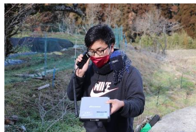
衛星電話での安否・受取確認