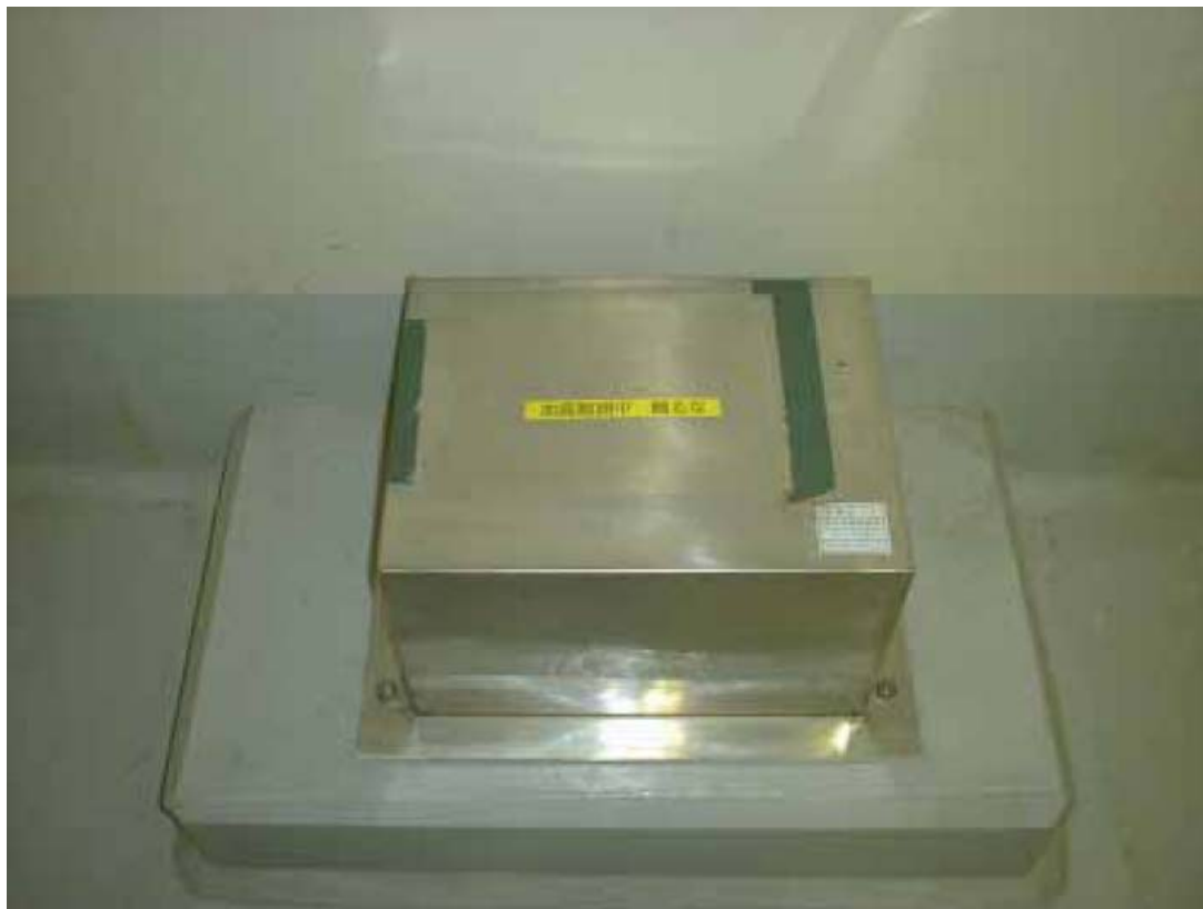
観測用地震計（検出部）