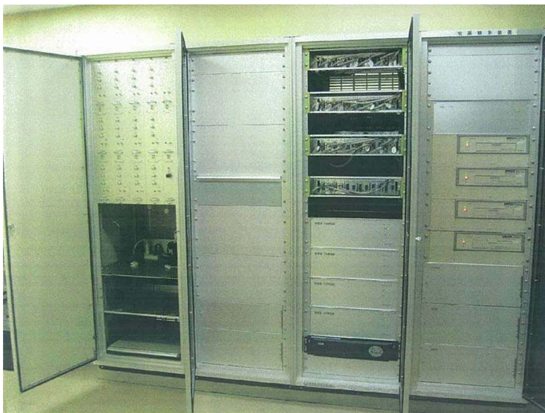
観測用地震計（測定部）