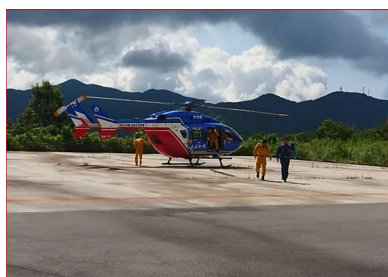
オフサイトセンターヘリポート(歴史文化博物館)