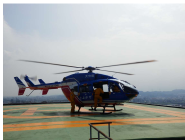
[大分県] 大分県庁屋上ヘリポート