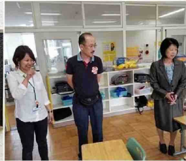
大分県立日田支援学校 大分県立日出支援学校