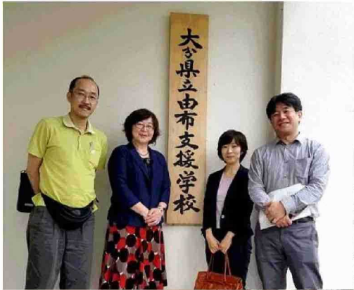
大分県立由布支援学校 大分大学教育学部 附属特別支援学校