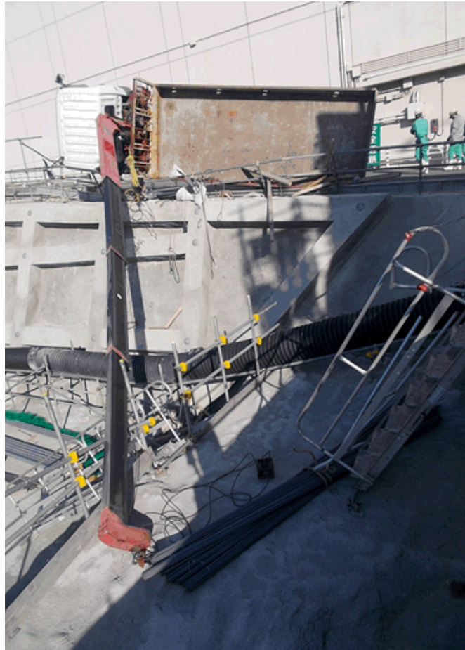
(クレーン付きトラック転倒)