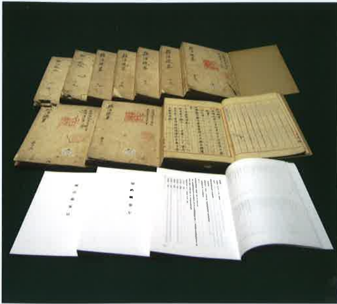
『県治概略』の原本(中・上段)と翻刻版(下段)

内容は政治・経済分野など多岐にわたっており、まさに草創期の大分県政を知る上で欠かすことが出来ない史料群です。