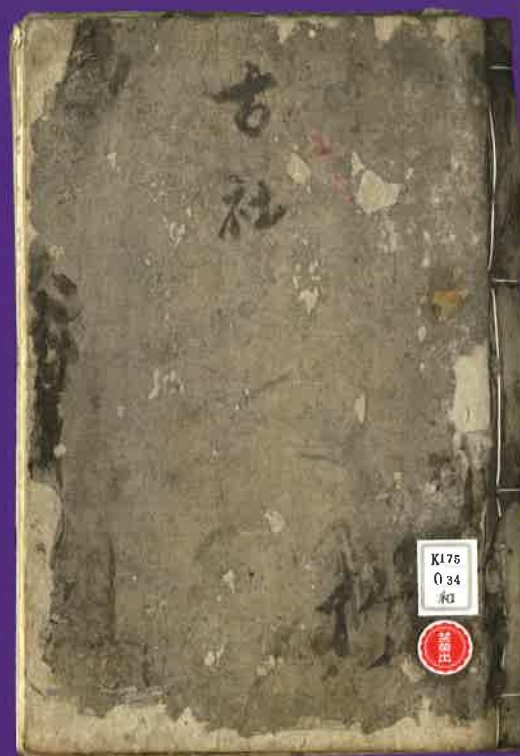
「古社」(表紙及び表紙裏)