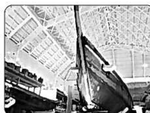
⑬海の資料館 (佐伯市)

木の舟や船をとる道具を展示しています。(国重要有形民俗文化財「薩江の漁船用具」)