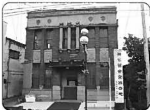
③旧共同野村銀行社屋 (豊後高田市)