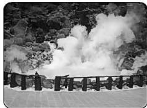
⑧別府の地獄 (別府市)