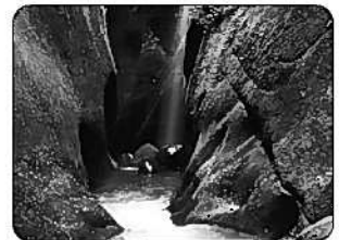
⑩由布川峡谷 (由布市)