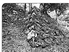
⑰角牟礼城跡 (玖珠町)