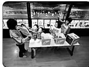
⑨大友氏遺跡歴史体験学習館 (大分市)