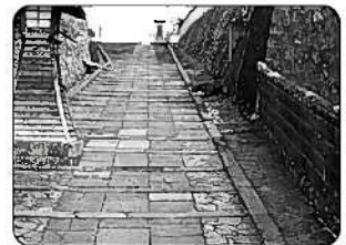
⑥杵築城下町 (杵築市)