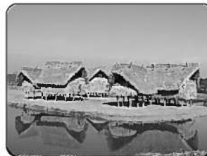
⑤国東市歴史体験学習館 (国東市)