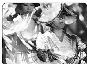
⑫津久見扇子踊り (津久見市)