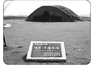
②城井1号掩体壕 (宇佐市)