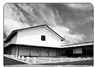
⑭神楽会館 (豊後大野市)

木の舟や船をとる道具を展示しています。(国重要有形民俗文化財「薩江の漁船用具」)