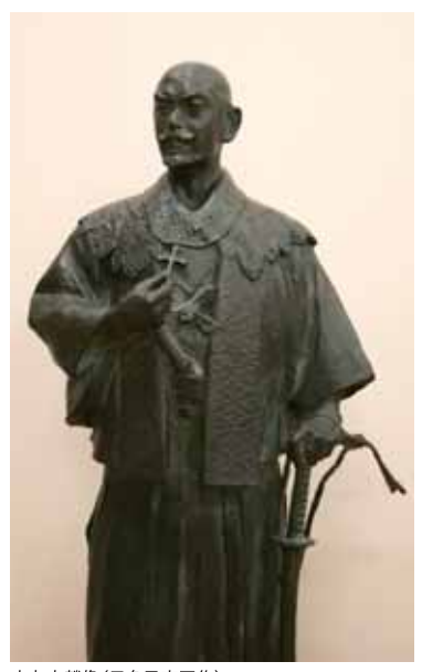
大友宗麟像(日名子実三作)

■問い合わせ先／大分県立先哲史料館 TEL 097-546-9380 大分市王子西町14番1号 ■時間／9:00～17:00 ■休館日／第1・3・5月曜日