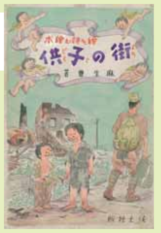
『街の子供』表紙(麻生豊・画)

■開館時間／9:00～17:00(入館は16:30まで) ■休館日／月曜日(祝日・振替休日の場合はその直後の平日) ■問い合わせ先／大分県立歴史博物館 TEL 0978-37-2100 ■観覧料／一般/310円(200円) 高・大生/150円(100円) ※中学生以下および土曜日の高校生の観覧は無料です。※( )内は20名以上の団体のお一人様の料金です。 ※身体障害者手帳・療育手帳・精神障害者保健福祉手帳をお持ちの方と、その付き添いの方1名は無料です。