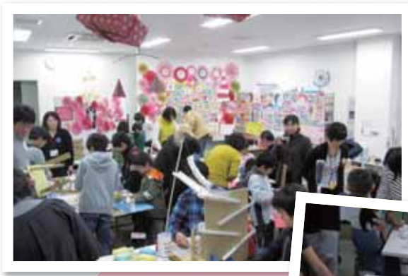
O-Laboスタッフ「サイエンスギャラリー」