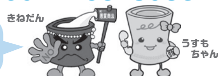
(臼杵市消費生活センターキャラクター)