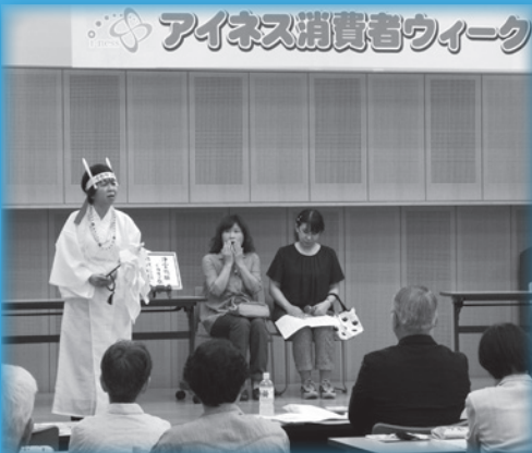
悪質商法の寸劇を演じるアイネス消費生活相談員