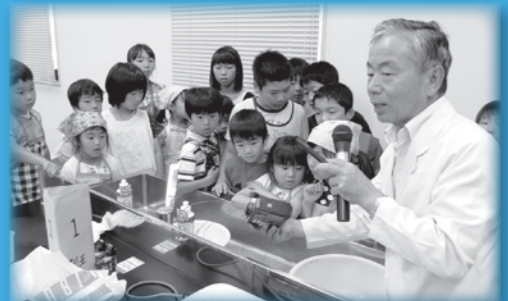
実験講座でアイネス職員の説明に聞き入る子どもたち