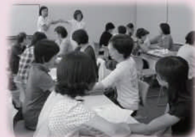
アロマでハンドトリートメント 〈NPO リラクセーション桜〉