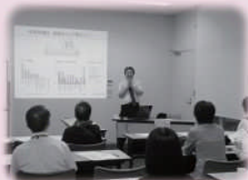
ストレスを住宅で解決!? (NPOおおいたデザインセンター)