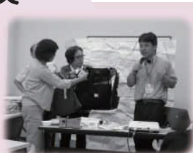
防災について考える 〈コープおおいた〉