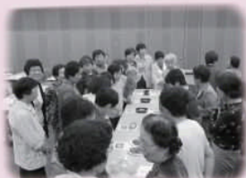
食品ロスについて考える 〈生活学校〉