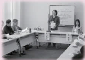
お金の使い方は大丈夫? 〈グリーンコープおおいた〉