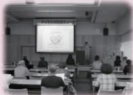
成年後見制度 〈NPO市民後見ささえあい〉