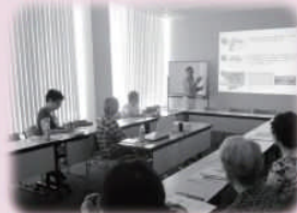
ジェネリック医薬品とは 〈NPO おくすり研究会〉