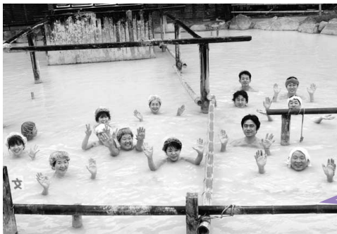
▲「オンパク」の一場面から・・・温泉名人と温泉の素晴らしさを「体感」しています。

〔NPO法人ハットウ・オンパク ホームページ http://www.onpaku.jp/ 〕