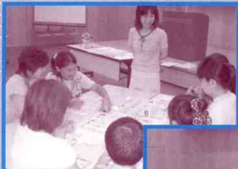
夏休み親子消費者スクール