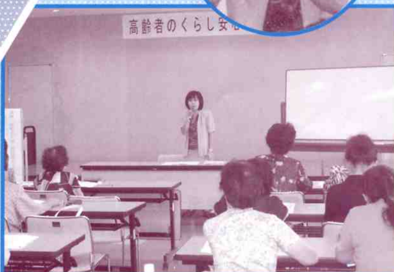
高齢者のくらし安心セミナー