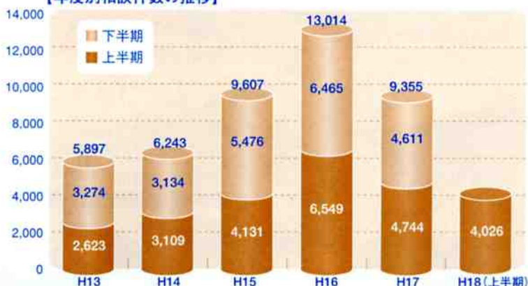
【年度別相談件数の推移】

これは、グレーゾーン金利や多重債務に関する相談が増加したものの、携帯電話やインターネット等を利用したオンライン等関連サービスに関する相談が減少したことが主な要因となっています。