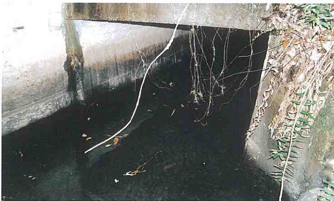
堅岩のため源ヶ鼻では20日で、わずか8尺5寸(2.6m)しか進まなかったそうです

小ヶ瀬井路は、享保19年(1734年)ごろから、文化12年(1815年)にかけて、度々、調査が行われていました。しかし、種々の悪条件を克服できずに、そのままにされていました。