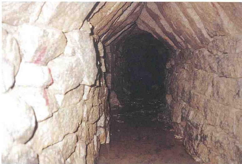
小ヶ瀬井路の内部(現存部)

玖珠川の水は、小ヶ瀬井路により、13ヶ村の田を潤し、 じょうない 城内川と合流し、増水したことにより日田川通船として、物資の河川運搬が可能になりました。小ヶ瀬井路は日田に大いなる恵みをもたらしました。