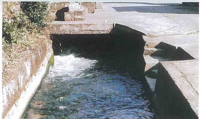
現在は九電と共用のサイホン形式になって、川床を通り出てきます

小ヶ瀬井路は、享保19年(1734年)ごろから、文化12年(1815年)にかけて、度々、調査が行われていました。しかし、種々の悪条件を克服できずに、そのままにされていました。