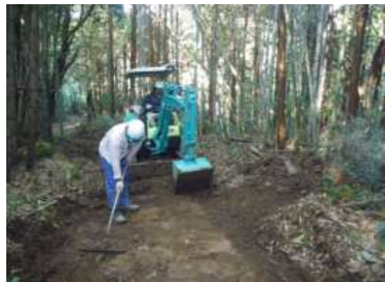
応援隊による事前準備