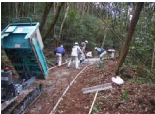
住民と応援隊の共同作業