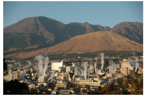
鉄輪温泉の湯けむり

今回「地元受入協議会」が魅力あるまちづくりの功績に対し、国土交通大臣表彰を受賞することとなり、より「住んでよし、訪れてよし」のまちづくりを推進していきたいと思っております。