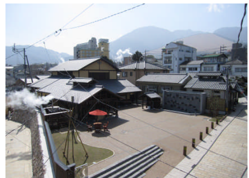
まちおこしセンター