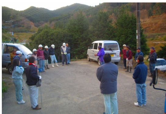
作業前のあいさつ