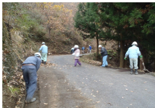
落葉などの除去作業