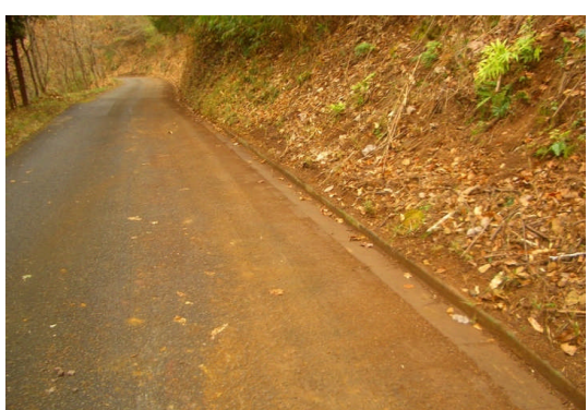
作業後の道路状況