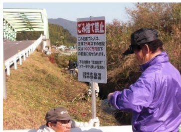
草刈後、「ごみ捨て禁止」の看板を設置