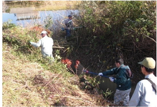
集落排水路沿いの草刈