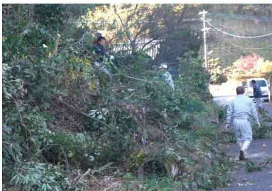
集落道の一部を覆っていた樹木を伐採