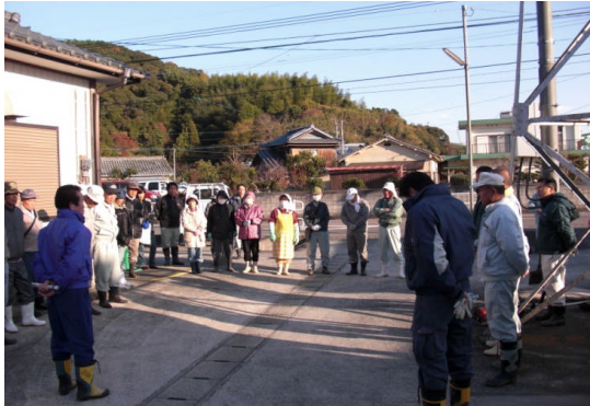
作業前のあいさつ