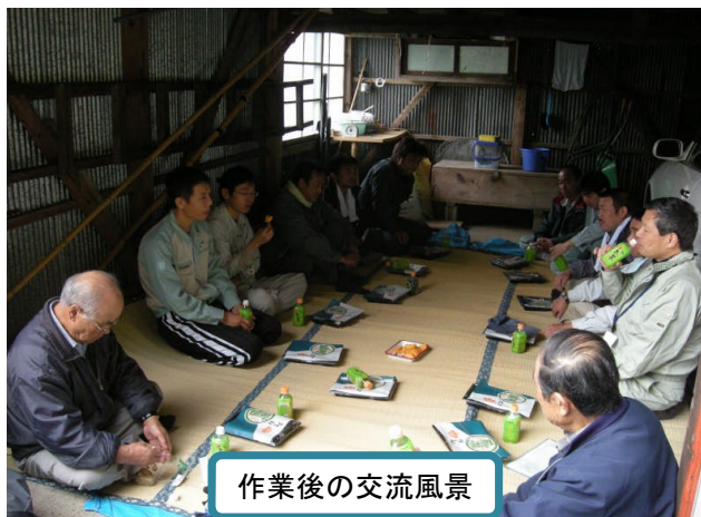
作業後の交流風景