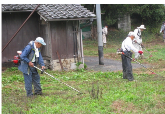
公民館横広場の草刈