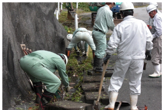
作業後、水路に水を流して状況確認