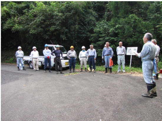
朝のあいさつ、注意事項説明