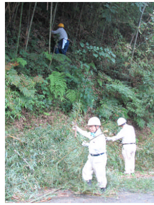
急な法面での作業