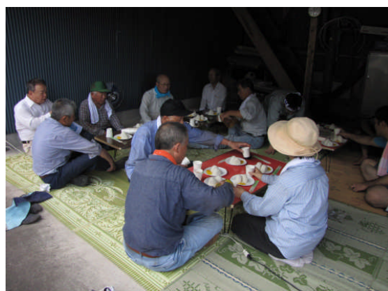
作業終了後の交流会