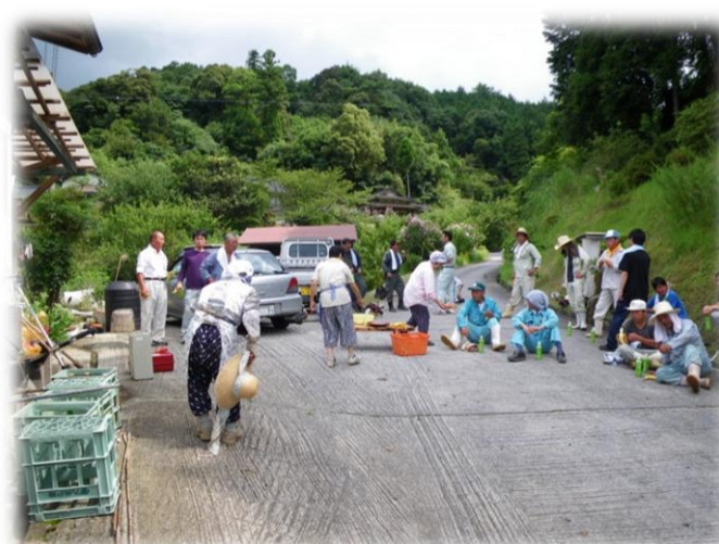
作業終了後の交流会