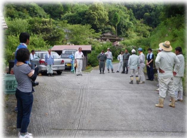
応援隊と集落の紹介、そして注意事項の説明